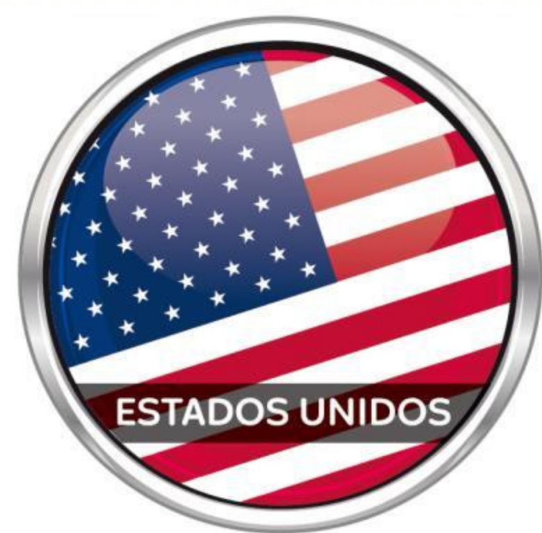
图 例 区