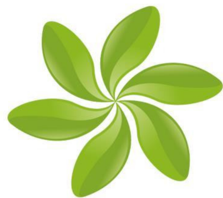
图 例 区